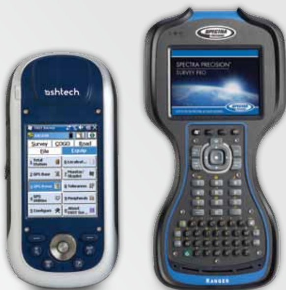
Ashtech ProMark 100

El software de campo Spectra Precision Survey Pro le proporciona un conjunto completo de características para todo tipo de proyectos de levantamiento. Es rápido, fiable y fácil de usar. Proporciona una integración, integridad de datos y rendimiento sin precedentes. El software Survey Pro se ofrece en diversos módulos para adaptarse mejor al trabajo, además de poder añadirle funciones según sea necesario.